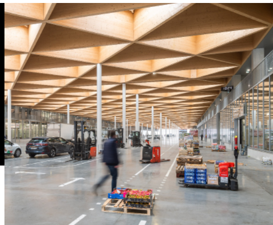
MiN Nantes Métropole