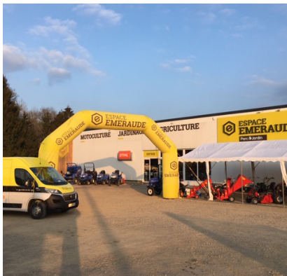
Espace Emeraude Blain