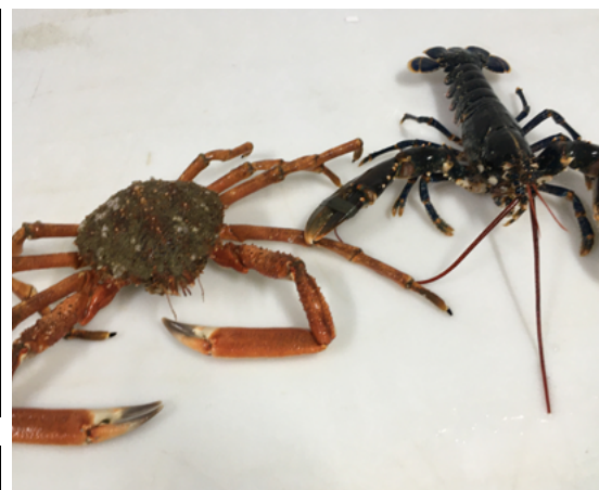
MiN Nantes Métropole

Le MiN Nantes Métropole privilégie de plus en plus les productions locales. Des produits régionaux français et internationaux sont aussi proposés. Il accueille, au sein de la grande halle fruits & légumes, le carreau des producteurs locaux.