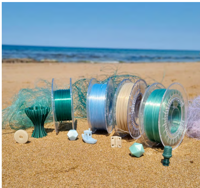
Filets de pêche, fils recyclés et objets réalisés

Cette collaboration entre ValorYeu et Fonto de Vivo témoigne de la volonté de ces deux entreprises ligériennes d'impulser une économie plus responsable et respectueuse des ressources. La place de l'eau est centrale pour ces deux acteurs du territoire. C'est pourquoi, ils s'engagent pour la sensibilisation en faveur de la préservation de cette ressource précieuse et vitale : l'eau. « Cette thématique est d'autant plus importante en contexte insulaire, comme c'est le cas pour les îles du Ponant, où la forte affluence de touristes pendant la période estivale entraîne une gestion complexe de l'eau. Soumis à des restrictions et habitués à collecter l'eau de pluie ou puiser l'eau d'un puits, les insulaires sont en quête de solutions alternatives permettant de compenser cette situation de tension du réseau d'eau. » explique Laure Jandet, fondatrice de ValorYeu.