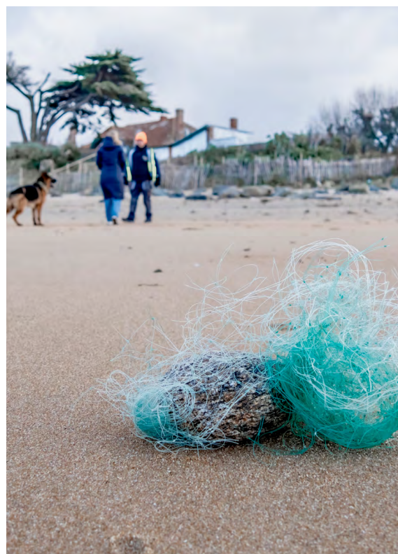
Filet de pêche échoué sur la plage