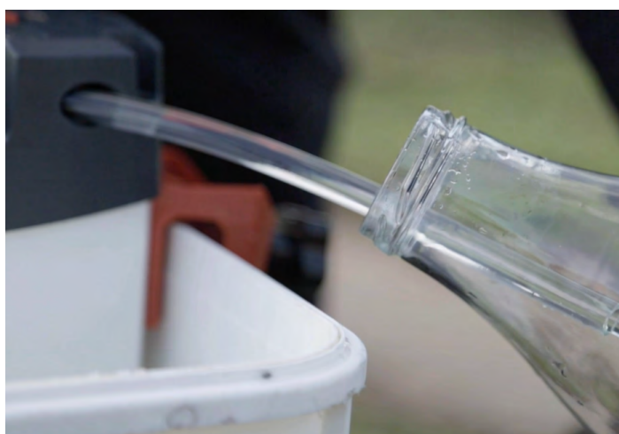
Le purificateur d'eau ORISA® en action

Le purificateur d'eau ORISA®, doté d'une membrane d'ultrafiltration, filtre les contaminations microbiologiques, bactéries, virus, micro-organismes et parasites tels que les protozoaires, ainsi que les microplastiques et autres matières en suspension présentes dans l'eau à filtrer. « Il est une parfaite solution pour répondre aux besoins des insulaires. La récupération d'eau de pluie donne accès à une réserve d'eau de secours pouvant être filtrée pour la consommer ensuite, sans risque de contaminations microbiologiques ou d'ingestion de matières nocives comme le microplastique. » souligne Anthony Cailleau.