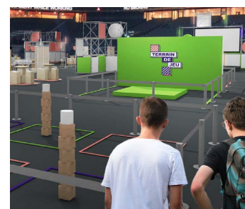
Visuels non contractuels

Événement gratuit pour les visiteurs, sur inscription : check.parisladefense.com